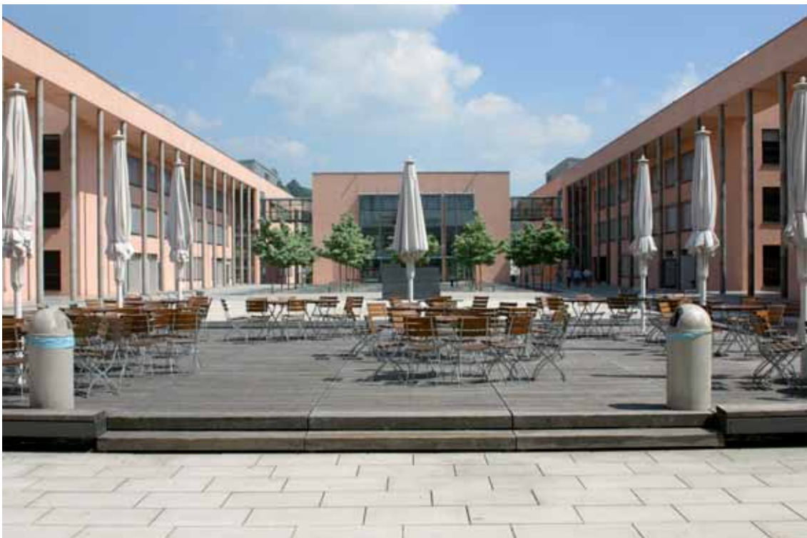
Der Hochschulcampus an der Donau und nahe dem Stadtzentrum

Gerade technologiebasierte und wissensintensive Unternehmensgründungen stehen aufgrund Ihres hohen Arbeitsplatzpotentials und Ihrer nachhaltigen Wachstumsmöglichkeiten im Fokus der Gründungsförderung und besitzen noch erhebliches Potential. Die Ausbildung zum „Unternehmer im Unternehmen“ wird hier, nicht zuletzt durch den Unternehmer-MBA, zielgerichtet durchgeführt.